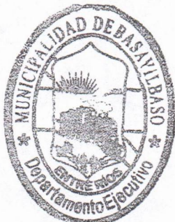
MARIO HERNÁN BESEL PRESIDENTE MUNICIPAL Municipio de Basavilbaso