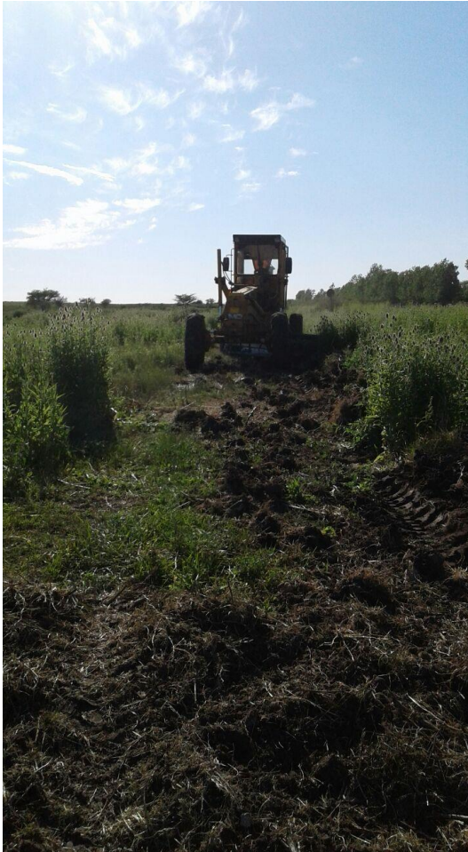
Limpieza y Desmalezado de distintos sectores de la Ciudad