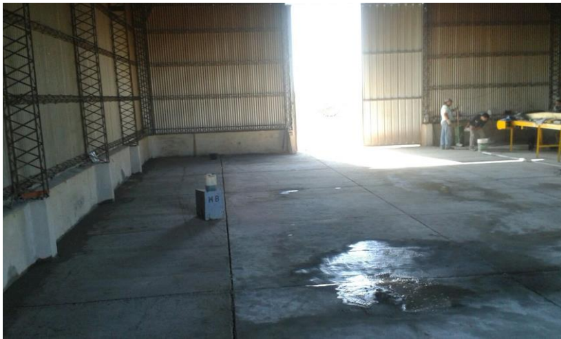
Cerramiento y construcción de suelo de Planta de Reciclado