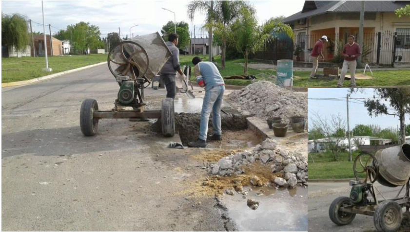
Reparación de Badenes