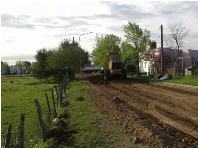
Nivelación, Compactación y Enripiado en distintas arterias de la Ciudad.